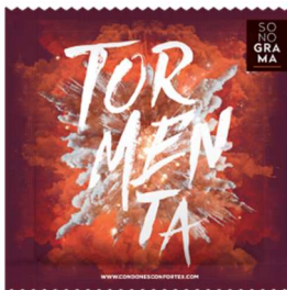
Preservativo Personalizado GRUPO SONOGRAMA

Y todo ello, con una presentación inconfundible, caracterizada por un diseño atrevido y lleno de color.